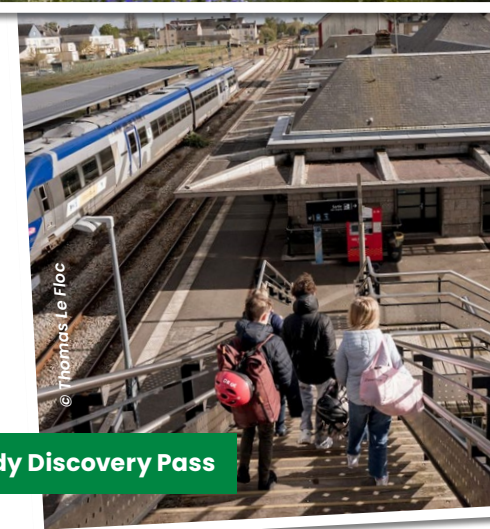
Normandy Discovery Pass