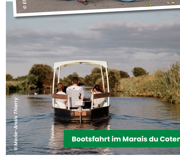
Bootsfahrt im Marais du Cotentin